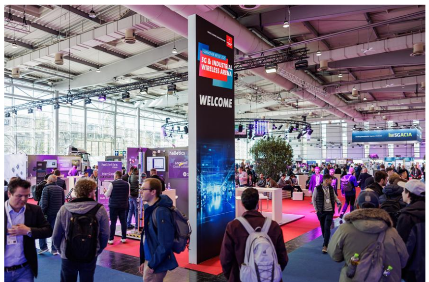
Bild von der „5G & Industrial Wireless Arena“ auf der HANNOVER MESSE 2025